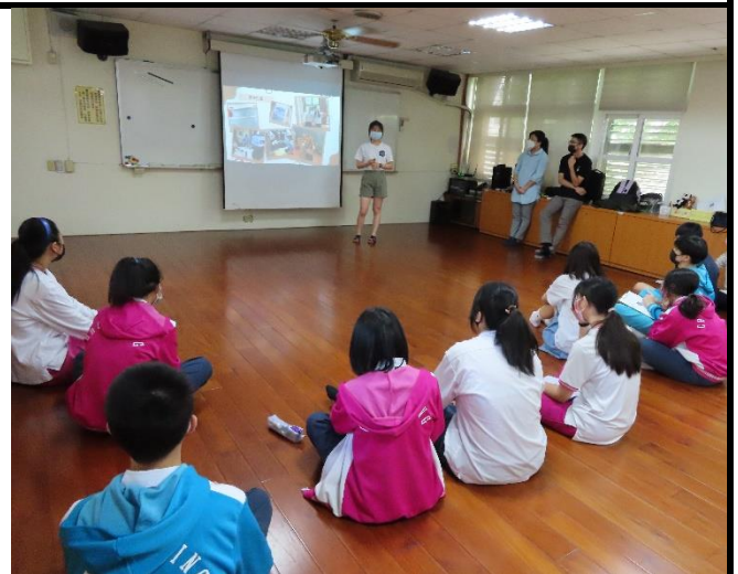
學長姐回校分享 聯繫國資情感