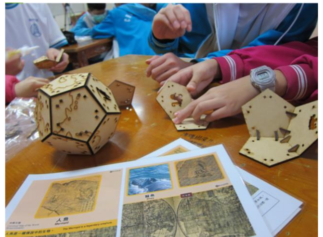
故宮坤輿地球 跨域的探索與設計