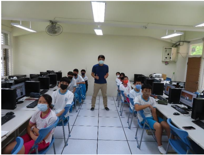
大師講座 動畫創作體驗

重慶國中國文資優資源班於民國七十二學年度設立，歷年來努力研究及推展，俾使資源教室能發揮其功能，提供良好的教學環境，啟迪資優學生在國語文方面的能力。語文，是一切學習的基礎。我們透過課堂的教學與實作的機會，除了發展孩子在語文上的天賦之外，更讓孩子獲得「學習」的技巧。讓他們在往後的學習，可以站在資優班的學習基礎上，學得更好，飛得更高。