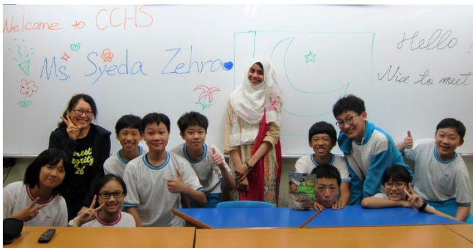
真人生活書 將國際視野帶入課程之中